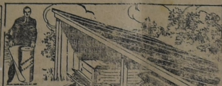
PARA EL GALPON