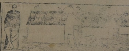
PARA CHIQUEROS, GALLINEROS, ETC