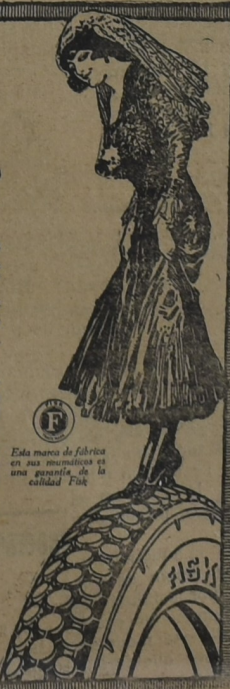
Esta marca de fábrica en sus neumáticos es una garantía de la calidad Fisk

Recomendamos con el mayor entusiasmo los neumáticos "RED TOP" de Fisk.