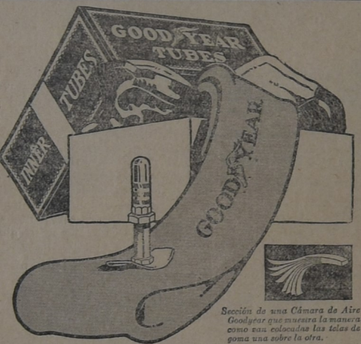
Sección de una Cámara de Aire Goodyear que muestra la manera como son colocadas las telas de goma una sobre la otra.

Para la seguridad de sus neumáticos compre Cámaras de Aire Goodyear