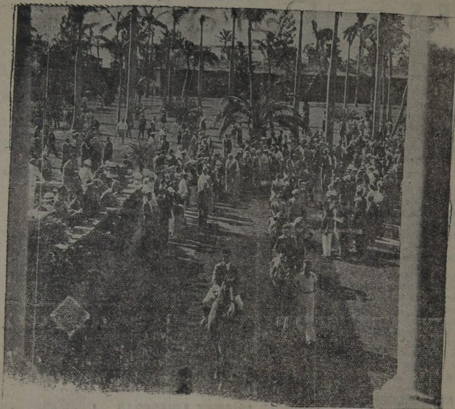
Una escena del famoso hipódromo de Hialeach Park donde se inició recientemente la temporada hipica de 1936 que marcó un verdadero record de apuestas. Es uno de los más pintorescos de América

Ofrecemos un variado surtido de artefactos eléctricos para confort y decoración del hogar.