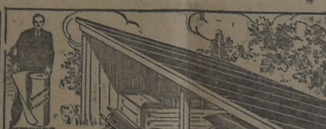
PARA EL GALPÓN