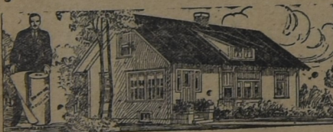
PARA LA HABITACIÓN

AL principio, hace ya muchos años, cuando iniciamos la importación de este techado, los interesados lo compraban como para hacer experimentos. Hoy, que los años y la práctica lo han consagrado como el techo ideal para toda clase de construcciones, sin excepción, su uso se ha generalizado a tal punto que muchas veces la demanda supera la importación. Y si el artículo no fuera de primer orden, no lo venderíamos nosotros.