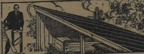
PARA EL GALPÓN