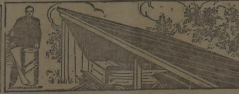
PARA EL GALPÓN