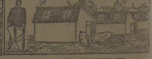
PARA CHIQUEROS, GALLINEROS, ETC.

Enviamos, a solicitud, muestras de los diferentes tipos, instrucciones para su colocación, precios y demás detalles de interés.