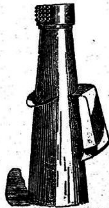
APARATO PARA CUIAR LA SEDA Á MANO