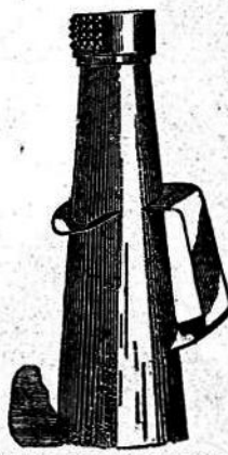
APARATO PARA CURAR LA BARRA A MANO