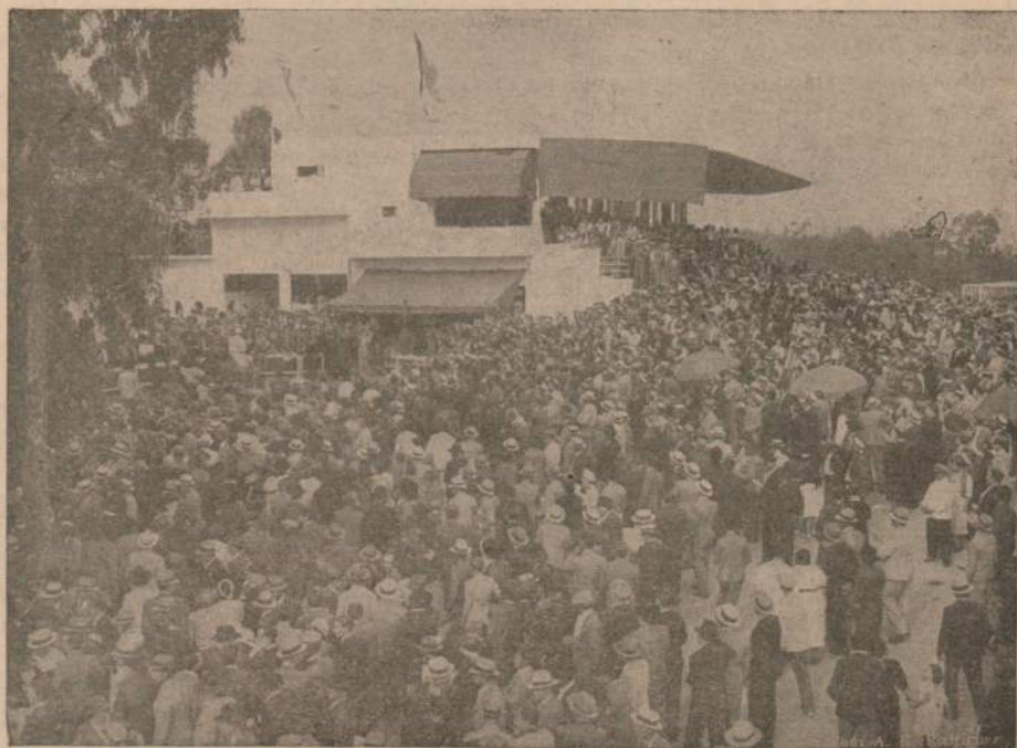
Vista del progresista Hipódromo pedrense en uno de sus días de numerosísima concurrencia.