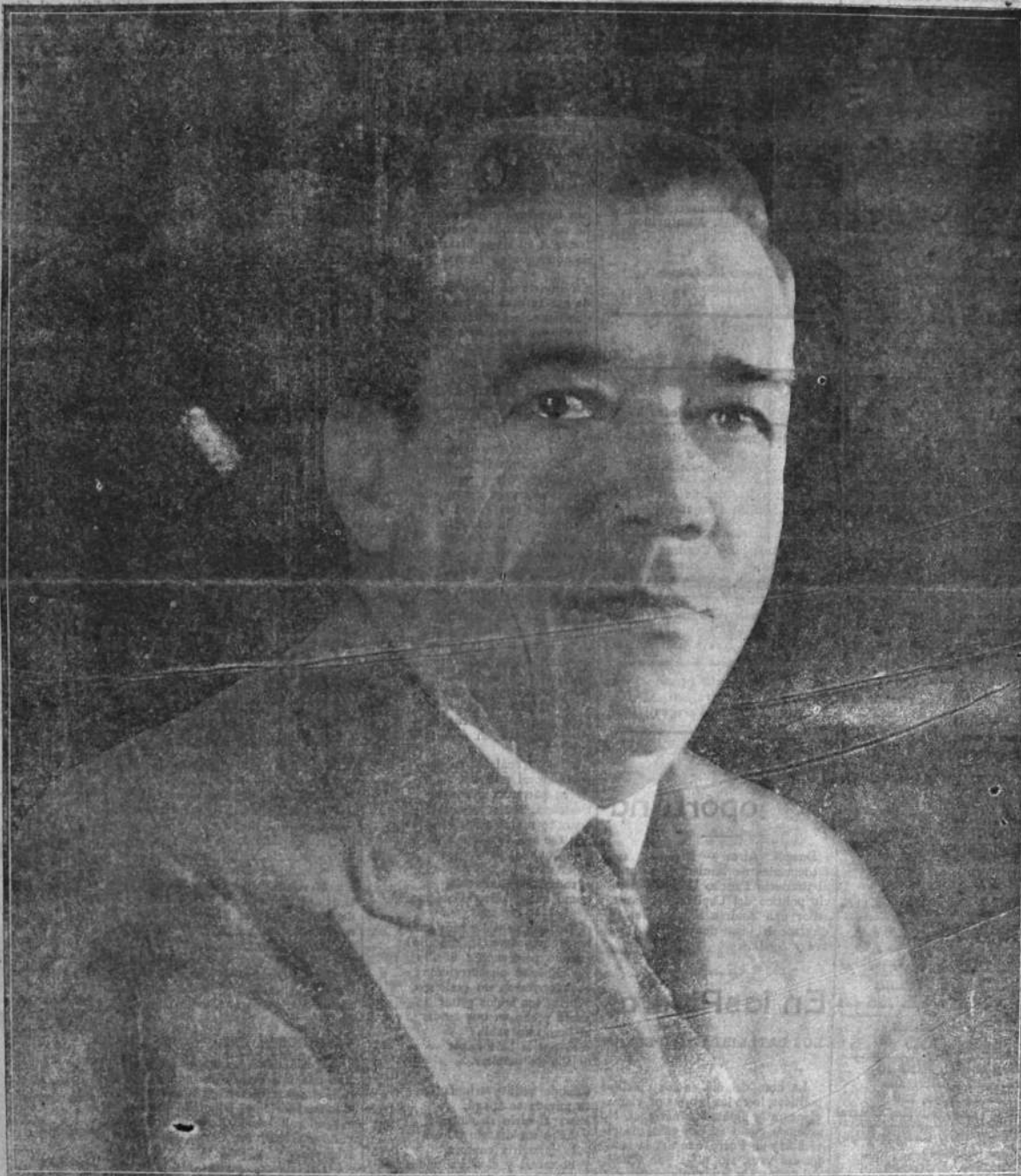
NUESTRA HOJA SE ENGALANA HOY CON LA PELLANTE FIGURA DEL EMINENTE CIUDADANO ING. JOSÉ A. OTAMENDI DESTACADA PERSONALIDAD DEL HERRERISMO; EL HOMBRE DEL PUEBLO DENTRO DE LAS MUCHEDUMBRES BLANCAS