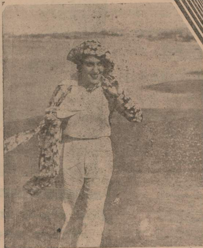
La mujer goza del don admirable de saber realzar su natural hermosura