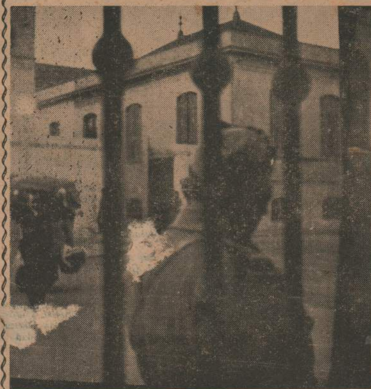
Después de 23 días de cárcel impuesta por la dictadura legal, los primeros obreros recobran la libertad.

Ilustrados por estos principios es que nos planteamos como primer paso imprescindible la reposición de los centenares de obreros destituidos e impedir toda deportación. POR ESO COMPAÑERO OBRERO, OS LLAMAMOS A NUESTRA LUCHA.