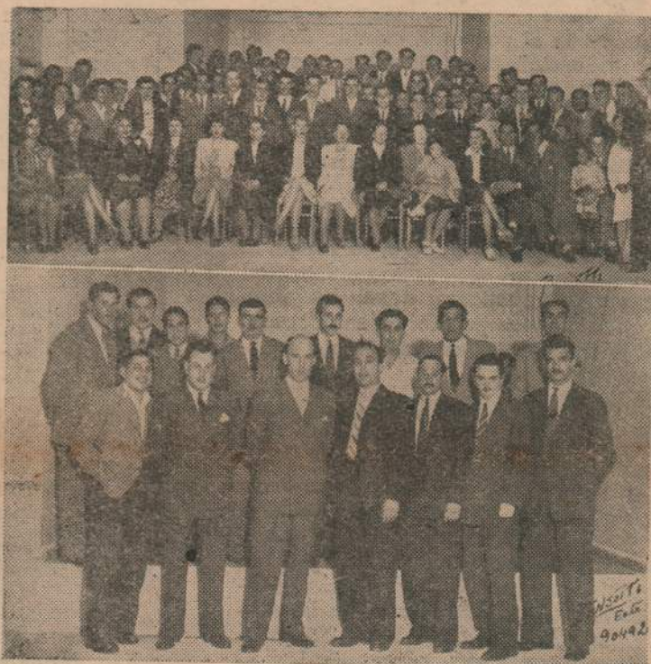
Concurrentes a la inauguración de nuestro local. La Comisión Directiva, nuestro asesor jurídico y miembros de las instituciones invitadas al acto realizado con tal motivo.

Luego se cerró el acto con un hermoso festival bailable, el cual a pesar de su resonante éxito, no comprendió exactamente el sentir nuestro, por el hecho de que tuvieron que ser —en gran parte— muchachas que no eran de nuestro Sindicato quienes dieron brillo a tan hermosa fiesta, ya que fueron bastante pocas las compañeras nuestras que se hicieron presente. De to-