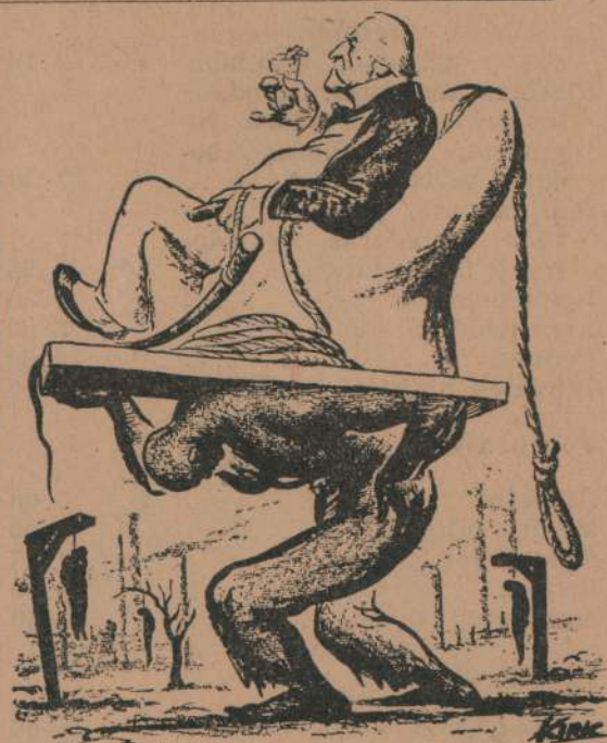
Como soporta el pueblo el peso del capitalismo