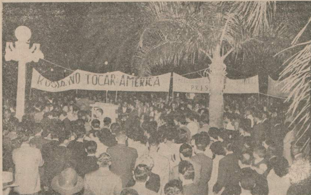
Un aspecto del gran acto democrático realizado por la CEI en Dolores