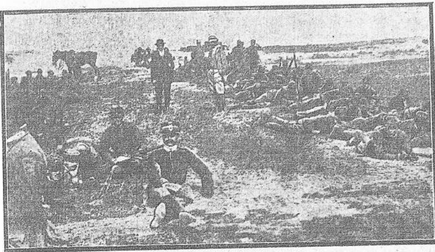
Granaderos en reposo después de la batalla y toma de Ain-Zara