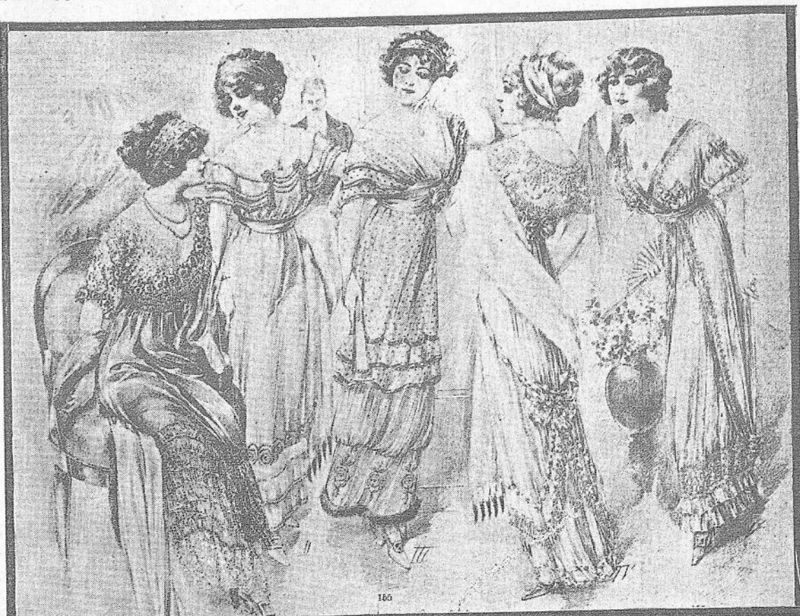
I—Traje de baile de muselina verde manzana y encaje blanco. Cuerpo dispuesto sobre un solo lado, flocos de cuentas de vidrio verdes, guirnalda de rosas color rosa. Fondo de liberty blanco.