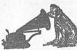
"HIS MASTER'S VOICE"

y habrá desterrado de su hogar, la tristeza, el spleen, la morriña.