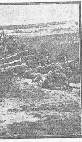
Esta tarde se vió una columna enemiga en marcha, pero a remota distancia. — Corresponsal.

El presidente del Consejo de Ministros, Mr. Poincaré, responderá el lunes próximo