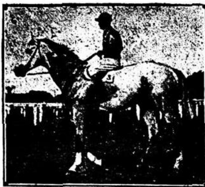
GREY FOX. El formidable tordillo, héroe del clásico «Pellegri»; único caballo que ostenta el título de vencedor de Botafogo, y que recientemente acaba de caer batido por aquel en el célebre match de revancha.