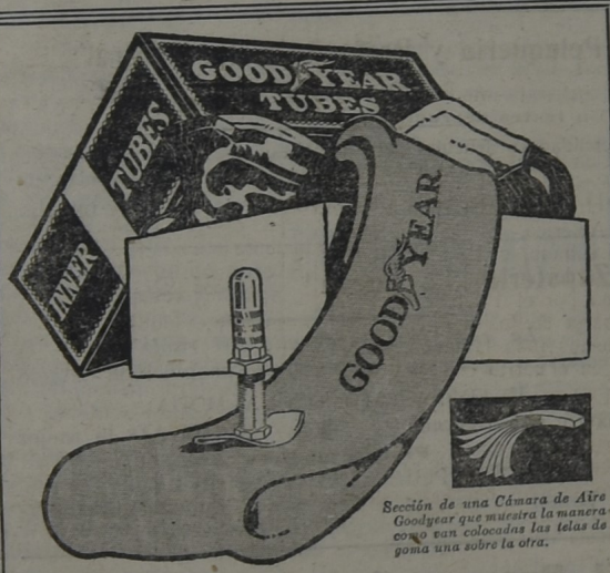
Sección de una Cámara de Aire Goodyear que muestra la manera como son colocadas las telas de goma una sobre la otra.

Calle 18 de Julio esquina Hammet Fray-Bentos Casa de comercio bien surtida y de ventas al contado Cuando no encuentre el artículo que busca, si no ha ido a lo de Onetto no desespere, pues muchas veces encontrará en su casa lo que no se halla en ninguna parte, Reparto a Domicilio Teléfono "La Unión" N.º 78