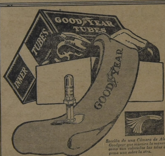
Sección de una Cámara de Aire Goodyear que muestra la manera como son colocadas las telas de goma una sobre la otra.

Para la seguridad de sus neumáticos compre Cámaras de Aire Goodyear