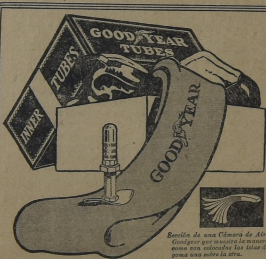
Sección de una Cámara de Aire Goodyear que muestra la manera como son colocadas las telas de goma una sobre la otra.

Para la seguridad de sus neumáticos compre Cámaras de Aire Goodyear