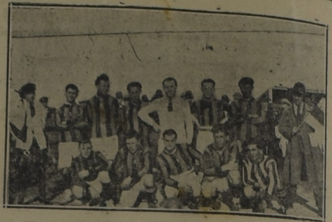
Team de primera división del Club «Río Negro» que mañana se medirá con el fuerte conjunto de la misma categoría del Club «Peñarol».

Salvo a nuestro combinado de una completa derrota las líneas de defensa y el arquero que fueron los héroes de la