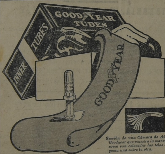
Sección de una Cámara de Aire Goodyear que muestra la manera como van colocadas las telas de goma una sobre la otra.

Para la seguridad de sus neumáticos compre Cámaras de Aire Goodyear