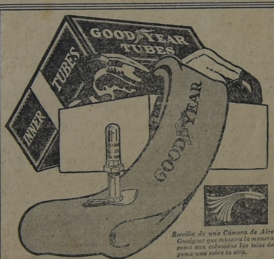
Sección de una Cámara de Aire Goodyear que muestra la manera como son colocadas las telas de goma una sobre la otra.

Para la seguridad de sus neumáticos compre Cámaras de Aire Goodyear