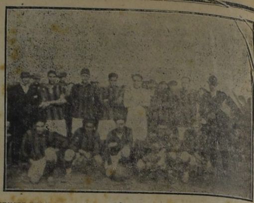
PRIMER TEAM DEL CLUB A. PEÑAROL QUE OCUPÓ EL 2.º PUESTO EN EL CAMPEONATO DE HONOR DE LA LIGA «EJIDO CHACRAS».

Como era de esperar, el partido resultó brillante habiendo conquistado en él nuestra Liga Departamental un gran triunfo, pues de tal lo podemos calificar dado su resultado, pues no esperábamos que él fuera de un empate de uno a uno y el haber marca do nuestro combinado el primer tanto y en tan brillante forma mientras que el marca do por los visitantes fué de esos que se califican de «zapallazo» ya que se produjo mediante un tiro largo y elevado que Rompani nada hizo