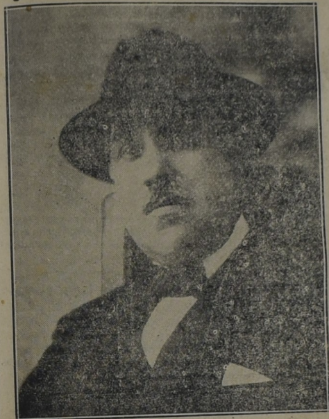
Dr. EMILIO FRUGONI

Candidato del Partido Obrero Socialista del Uruguay a Diputado Nacional