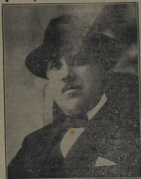
Dr. EMILIO FRUGONI

Candidato del Partido Obrero Socialista del Uruguay, a Diputado Nacional