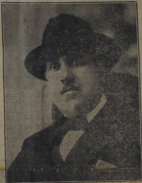
Dr. EMILIO FRUGONI

El ciudadano que vote por Frugoni lo hará sabiendo que vota a un hombre que por sobre todos los odios y las pasiones del cintillo, sabrá cumplir con su deber de representante del pueblo. El irá al Parlamento Nacional a trabajar y hacer trabajar por el bien del país en general y por el de la clase trabajadora en particular.