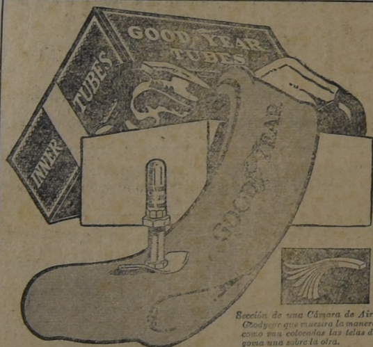
Sección de una Cámara de Aire Goodyear que muestra la manera como son colocadas las telas de goma una sobre la otra.

Para la seguridad de sus neumáticos compre Cámaras de Aire Goodyear