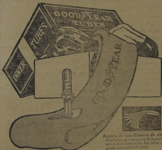
Sección de una Cámara de Aire Goodyear que muestra la manera como van colocadas las telas de goma una sobre la otra.

Para la seguridad de sus neumáticos compre Cámaras de Aire Goodyear