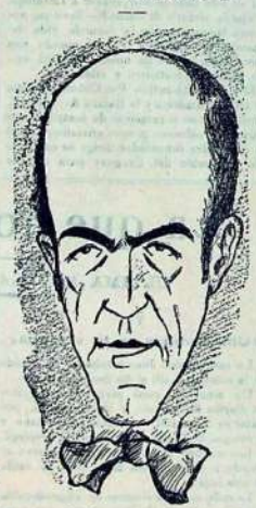
La cara de Manilla, el tener que susurrar de San José.