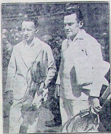
William Johnston (a la izquierda) y Francis T. Hunter, que con Tilden y Williams constituyeron el team de Estados Unidos que este año volvió a adjudicarse la Copa Davis

Los fabricantes de neumáticos de los principales factores que contribuyen a aumentar el sostenimiento del automóvil. Casi puede asegurarse que el 95 por ciento de las cubiertas que consumen en todo el país, son puestas fuera de servicio, antes de obtener el máximo del recorrido que en ellas se indica.