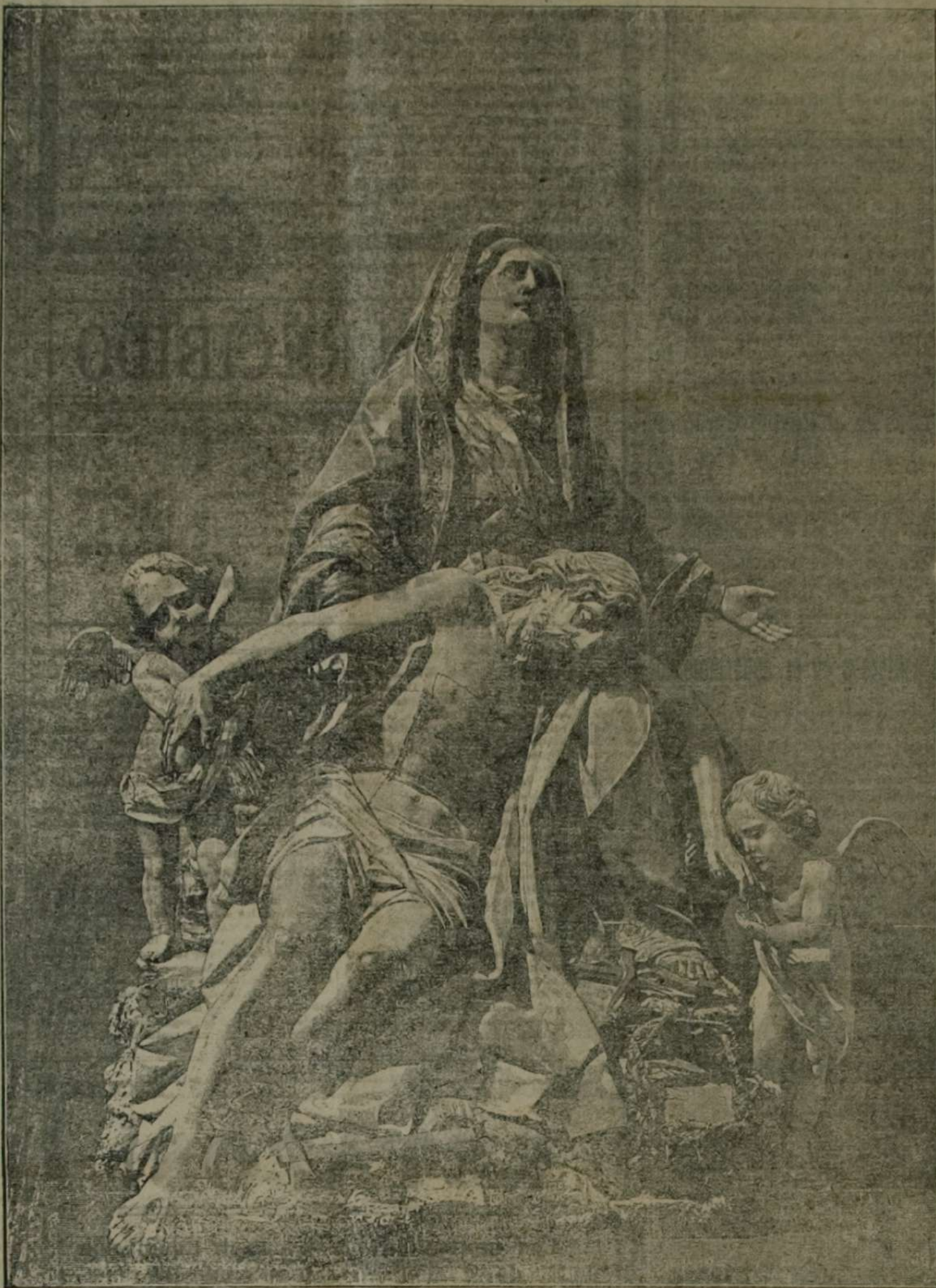
LA VIRGEN DE LAS ANGUSTIAS