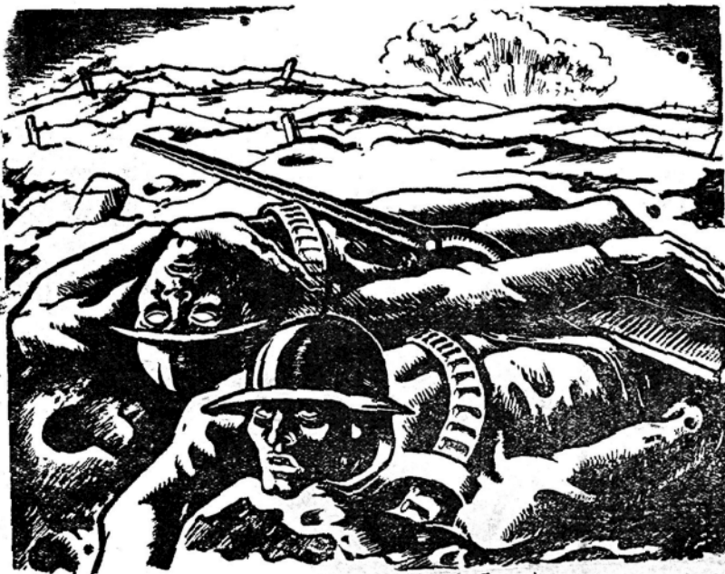
Los millones de masacrados exigen: ¡Luchar contra la Guerra!