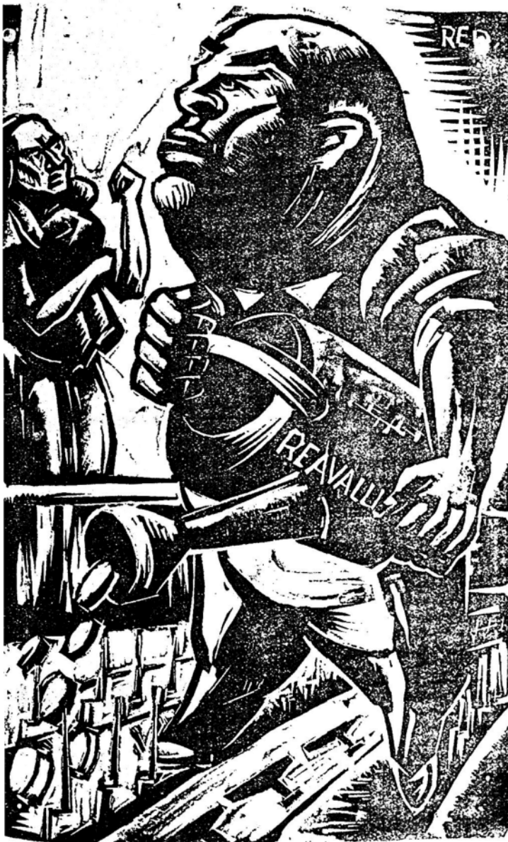
Cosecha del revalúo: aviones y fusiles.

En el gran acto del sábado ppdo. en Montevideo, contra los atropellos efectuados en los "Repartos Patrióticos"