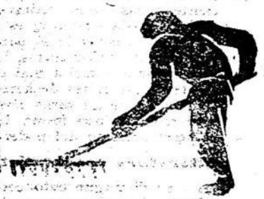
Paz y Trabajo

Si ha de hacerse el lunch o no, que en determinado momento pensamos, es hoy un problema muy difícil. Siempre existió una parte del estudiantado que entendían que ese dinero