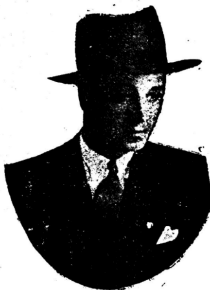
La canción de la Cultura de la U. P. Zona Sur