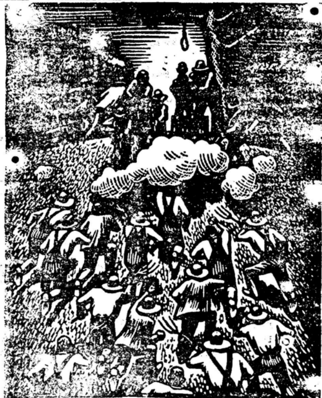
Linchamiento de negros

Y son ahora, generales españoles financiados por el oro de contrabandistas multimillonarios generales que creen en Dios quienes destruyen a España ofreciendo como presa a los países fascistas hambrientos de tierras, las islas feraces pobladas por sus antepasados; a cambio de la bomba y la metralla que matará a sus propios hermanos. Y estos señores generales no tienen más ofensas del pueblo español que, harto ya este de soportar siglos y siglos una plutocracia succionadora y tirana que lo retuvo en inferioridad de progreso; quieren sumarse, en justa aspiración, a los pueblos que trabajan y progresan; libres de amos y parásitos que los exploten y embrutecan. Cuando esta nota sea dada a publicidad acaso el pueblo español diezmando por la metralla fascista halla sido ya arrollado por los que tienen sobre él la fuerza del oro obtenido a cualquier precio y la consigna de terminar con todo hombre que no tenga pasta de traidor o de esclavo. Acaso Franco con sus legionarios haya pasado ya sobre los cadáveres calientes de sus hermanos para ordenar a algún cacique moro el toque de victorias sobre Madrid en ruinas; mientras Mola desde el Guadarrama contempla la obra con diabólica satisfacción como Nerón contempló a Roma incendiada por él. Y aquí cabe aquella opinión histórica: «El espectáculo es digno de ti, y tu eres digno del espectáculo».