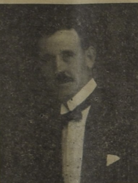
Primer Presidente Honorario y primer referee que tuvo el "Nacional Foot Ball Club".

pasar una nota de agradecimiento quedando dicho señor exonerado de pagar cuota alguna.