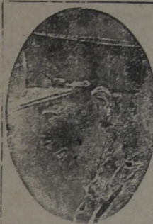
Minucio de Windsor

que llegó a Miami acompañando su esposa que se someterá a una operación bucal.