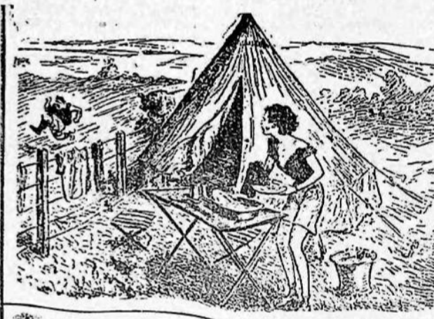
— No deberas fatigarte de ese modo al comienzo del "camping". (De "The Humorist", de Londres.)

Y entre tanto ruido y tanto derroche, el pueblo auténtico nada determina ni decide; solo piensan los que aplauden, agradecidos al men drugo, y los que se hartan, estimulados por los aplausos.