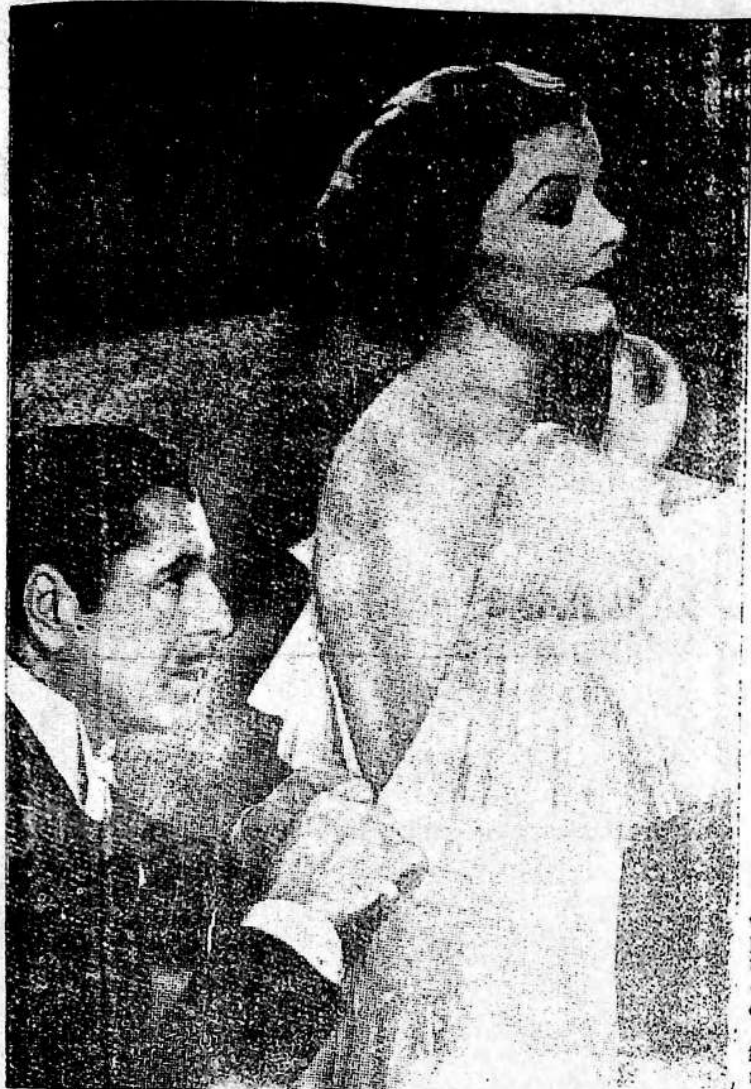
He aquí la bella Mirna Loy y Warne Baxter, intérpretes de la interesante película "Me divorcio por amor"