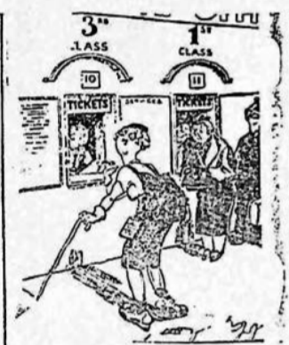
PRIMAVERA — Deme una tercera de regreso para que la primera brisa de la primavera acaricie mis mejillas en flor. (De "Evening News" de Londres.)

Un jardín primaveral de una belleza extraordinaria