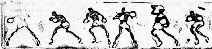
Evocación de varias de las poses de box contempladas el domingo en el partido de football.

Ya como se ve, el asunto veía atravesado.