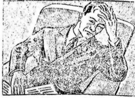
...llegué a casa cansado, nervioso... ...con un dolor de cabeza inaguantable...