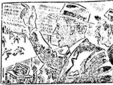
...la tarde presencié el partido de fútbol... ...el más emocionante que recuerdo...