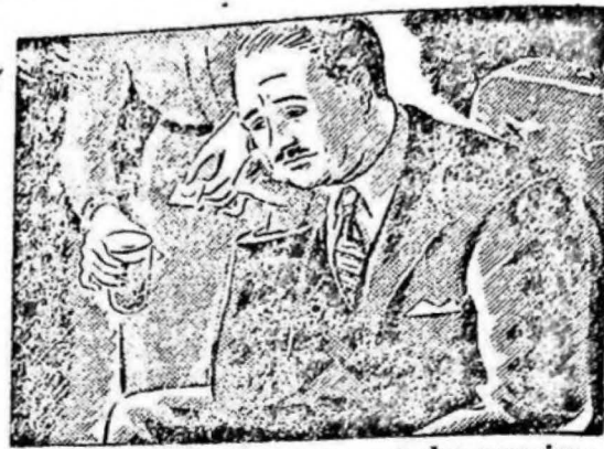
...cuando llegué a casa estaba nervioso y con un dolor de cabeza insoportable...