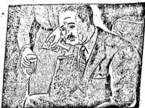
...cuando llegué a casa estaba nervioso y con un dolor de cabeza insupportable...