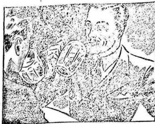
La noche anterior estuve con unos amigos en el café y me acosté muy tarde...

Cincuenta pesos, los Comisarios Treinta y seis pesos, los Subco-