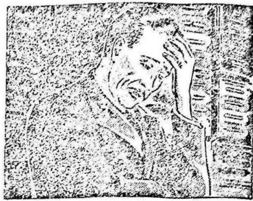
...estaba cansado, sin ánimo para trabajar y con un dolor de cabeza insoportable