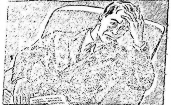
...llegue a casa cansado, nervioso y con un dolor de cabeza inaguantable.