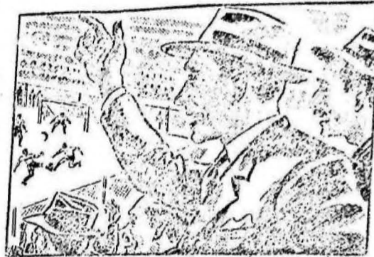
...esa tarde presencié el partido de fútbol más emocionante que recuerdo...