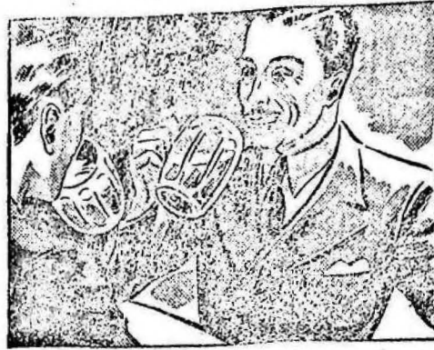
La noche anterior estuve con unos amigos en el café y me acosté muy tarde...