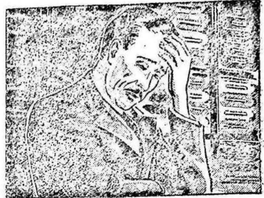
...estaba cansado, sin ánimo para trabajar y con un dolor de cabeza insoportable