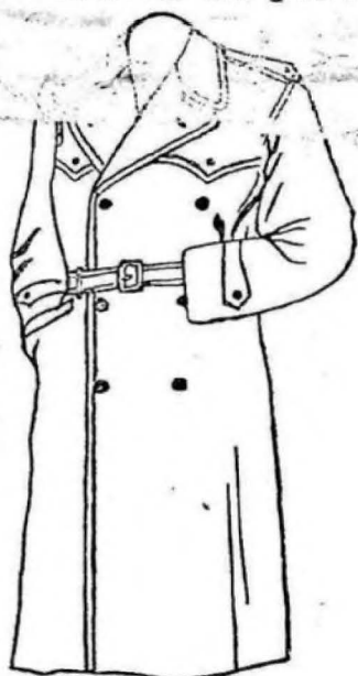
TRINCHERA forro entero tornasol $ 38.00