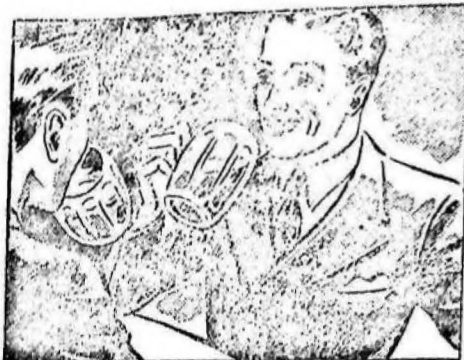
La noche anterior estuve con unos amigos en el café y me acosté muy tarde...