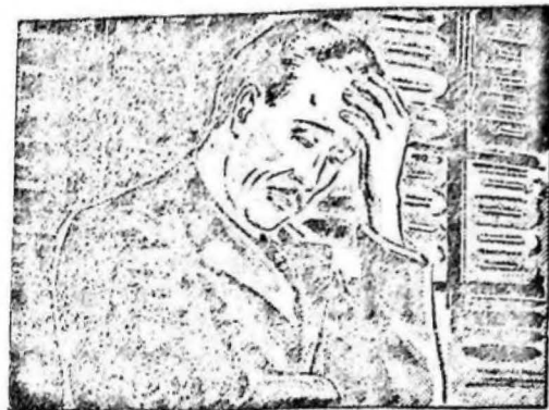
...estaba cansado, sin ánimo para trabajar y con un dolor de cabeza insostenible