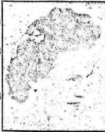
Peinado premiado en el reciente concurso

Unica casa en Durazno, que le hará la Permanente sin fuego ni electricidad.