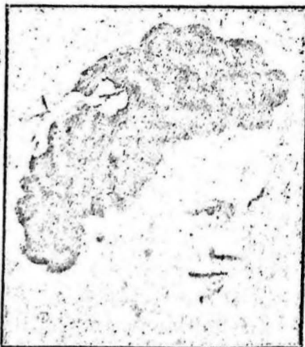
Peinado premiado en el reciente concurso

Unica casa en Durazno, que le hará la Permanente sin fuego ni electricidad.