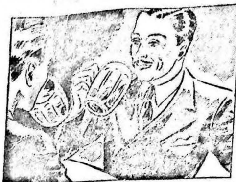
La noche anterior estuve con unos amigos en el café y me acosté muy tarde...

Cabe señalar pues, con aplauso, la presencia de ese factor, entre nosotros, como elemento apreciable de excelentes conquistas y de un mayor bienestar.