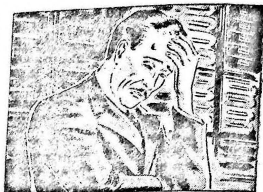
...estaba cansado, sin ánimo para trabajar y con un dolor de cabeza insoportable