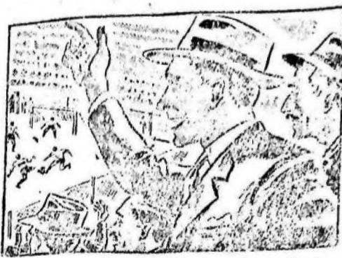
Esta tarde presencié el partido de football más emocionante que recuerdo...

El Poder Ejecutivo, por el Ministerio de Hacienda, acaba de declarar que de acuerdo con las leyes Marzo 3 de 1934, Enero 11