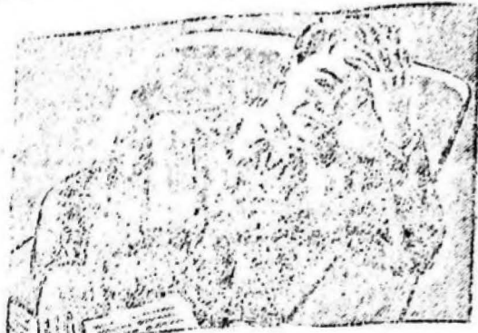
¡Llegue a casa cansado, nervioso con un dolor de cabeza insoportable!