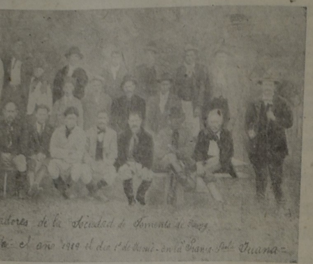
Fundadores de la Sociedad de Fomento Rural de Young. Fundada el año 1910 en la ciudad de Young, Uruguay.

INFORMES: TALLER MECANICO «MAURIN» Teléf. 99—Casa MARRONI.—Teléf. 5.—YOUNG.