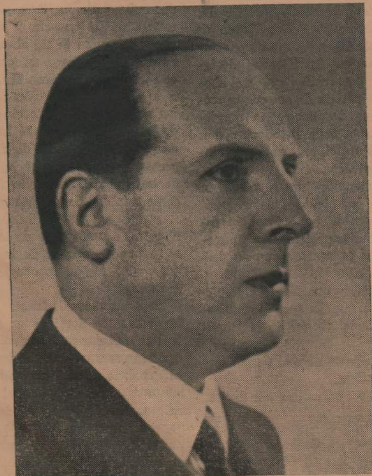
Dr. EDUARDO BLANCO ACEVEDO

Primer mandatario por la voluntad de un Pueblo, recibirá el Uruguay a torrentes el tesoro fertilizador que dimana del Patriotismo y del Talento